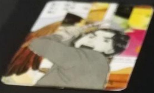
What is the character's name and what is his superpower?